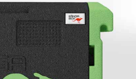
Dicht schließende Tür – keine Gerüche