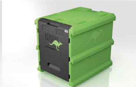
Stabil aus einem Stück: für eine lange Lebensdauer