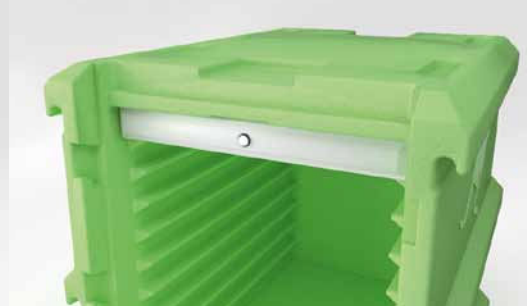
Einschubrillen für Hot- und Coolpack