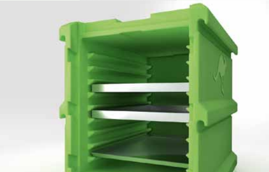
Wahlweise 10 oder 6 Einschubrillen