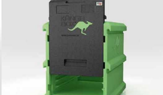
Herausnehmbare Schiebetür für einfachen Zugang