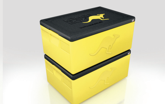
Stapeln ohne Verrutschen