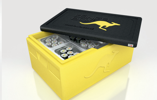
Passend für Gastronorm-Behälter