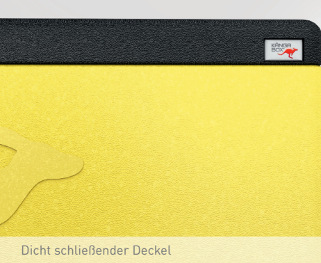
Dicht schließender Deckel