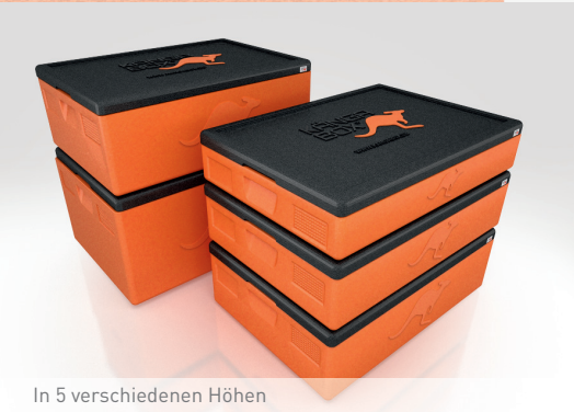
In 5 verschiedenen Höhen