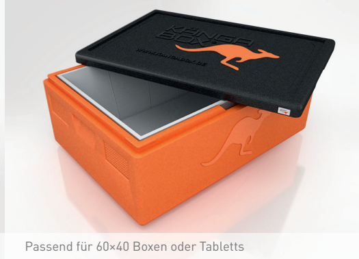
Passend für 60x40 Boxen oder Tablett