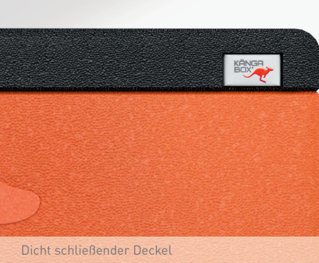
Dicht schließender Deckel