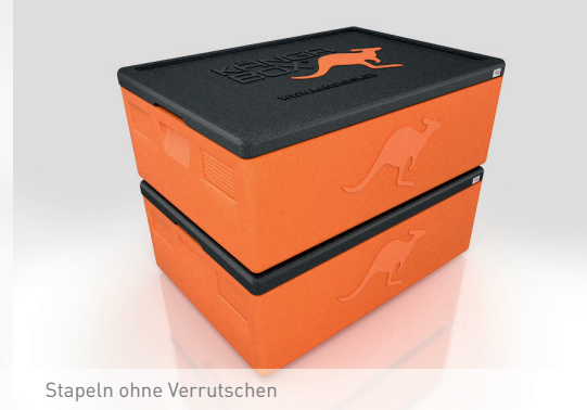
Stapeln ohne Verrutschen