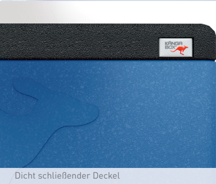
Dicht schließender Deckel