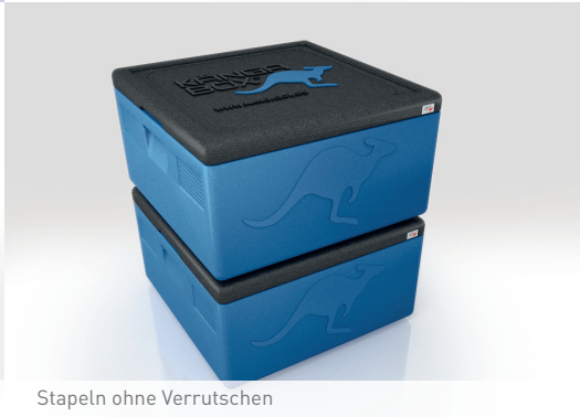
Stapeln ohne Verrutschen