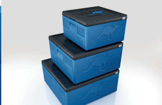
3 Größen in verschiedenen Höhen