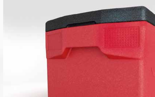
4 Etikettenfelder und ergonomisch geformte Tragegriffe