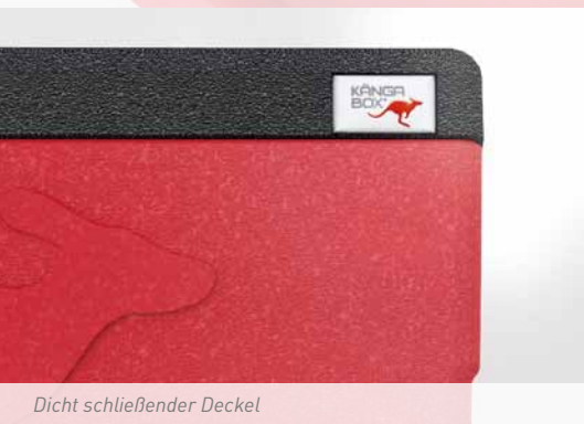
Dicht schließender Deckel