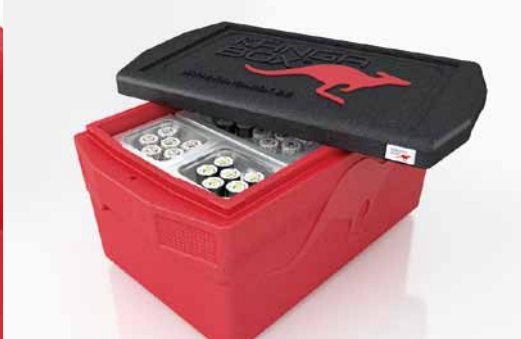
Passend für Gastronorm-Behälter