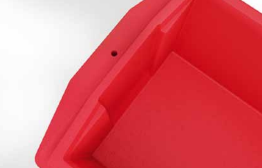
Griffmulde für leichtes Entnehmen