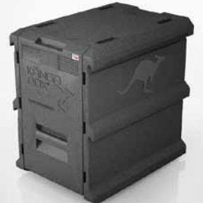
Stabil aus einem Stück: für eine lange Lebensdauer