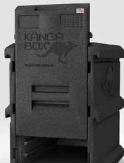
Herausnehmbare Schiebetür für einfachen Zugang