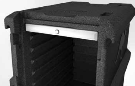
Einschubrillen für Hot- und Coolpack