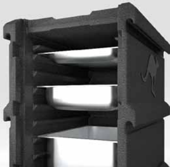
Wahlweise 8 oder 4 Einschubrillen