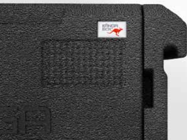
Dicht schließende Tür – keine Gerüche