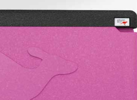
Dicht schließender Deckel