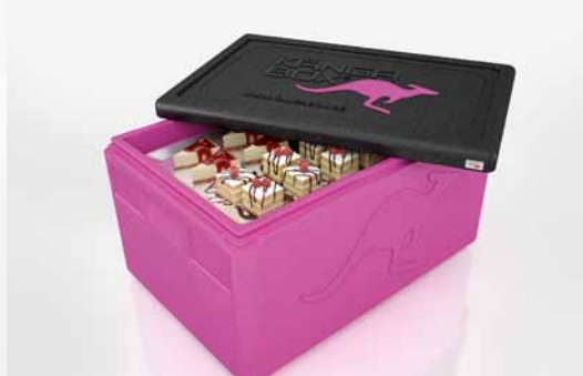
Passend für Gastronorm-Behälter