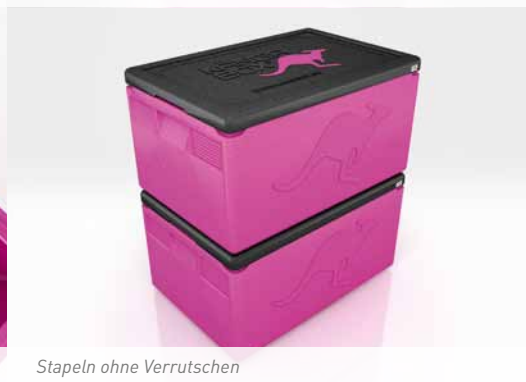
Stapeln ohne Verrutschen