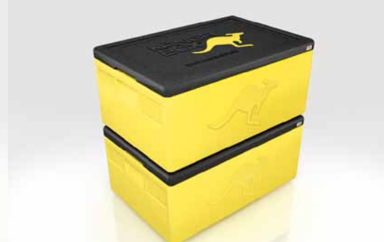
Stapeln ohne Verrutschen