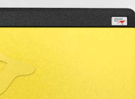
Dicht schließender Deckel