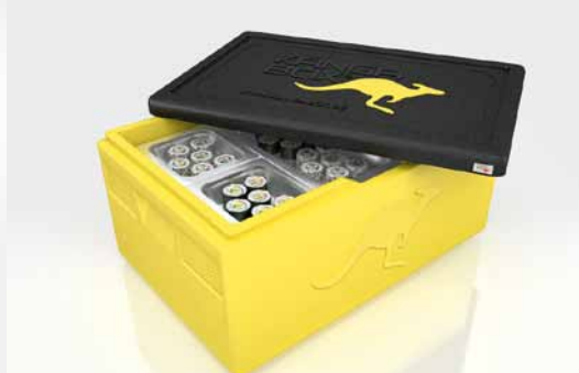
Passend für Gastronorm-Behälter